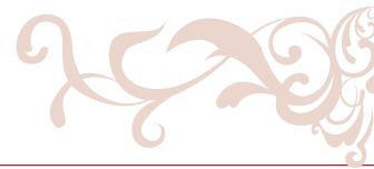
Table of Contents