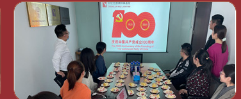
▲ 在建党一百周年来临之际，为庆祝中国共产党建党100周年，进一步加强党史学习教育，中伦文德各所党支部积极启动建党百年系列活动，组织开展党史学习教育。如“牢记初心使命，当好人民律师”主题的党课线上会议、学习教育《百炼成钢：中国共产党的100年》、“缅怀先烈不忘初心，植树造林青山常在”的党建+团建活动等。